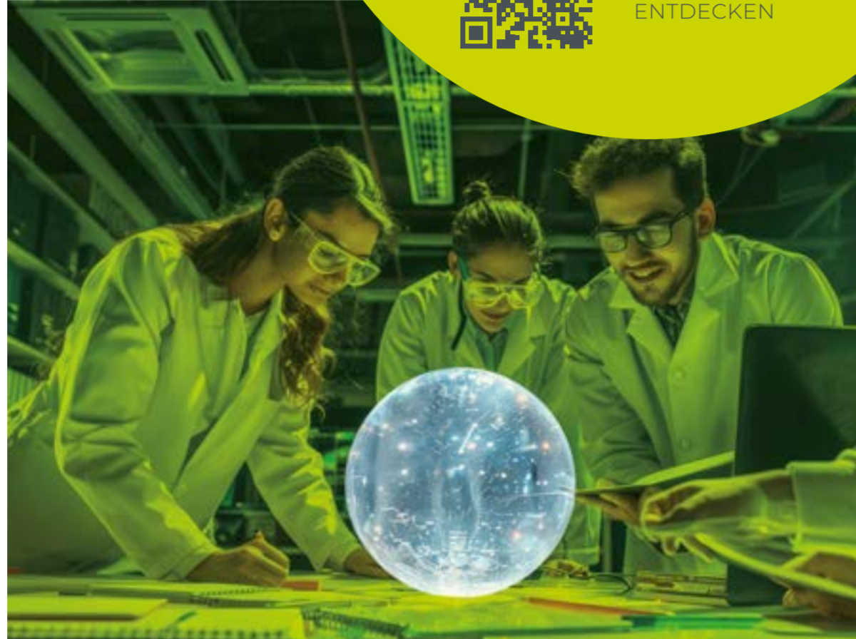
Für den SITA 24/25 werden innovative Ideen rund um die Verwendung der Glasperle in unterschiedlichen industriellen Bereichen gesucht.